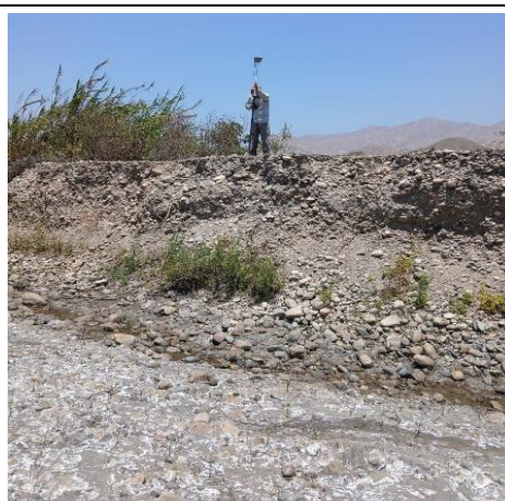
CAUCE DE RIO COLMATADO DIQUE EROSIONADO