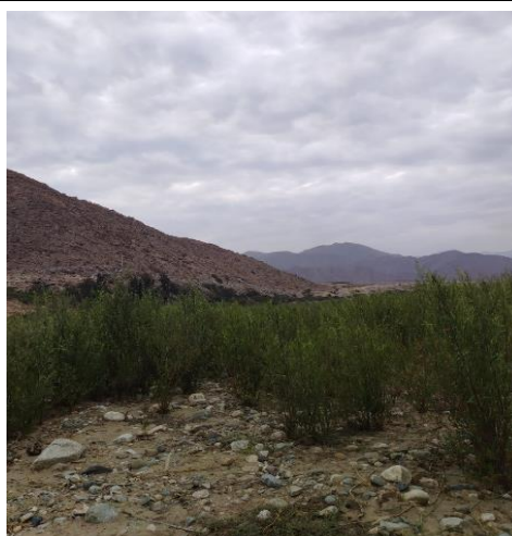
FOTOS DE CAUCE DE RIO, SE APRECIA BANCO DE MATERIAL EN EL CAUCE DE RIO VIRU